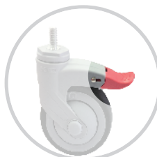
Bàn đạp siêu dài 超長踏板