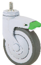
Khóa đa hướng 定向煞