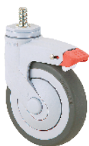
Khóa kẹp 雙煞