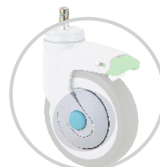
Bánh xe không từ tính 無磁腳輪

*Hình ảnh chỉ mang tính chất minh họa. Vui lòng tham khảo sản phẩm thực tế. *圖片僅供示意, 請以實際產品為主