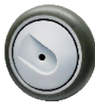
Bánh TPR lõi PP (Donut) 超級人造膠(大圓弧)