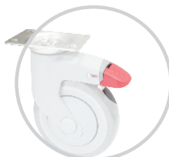
Bàn đạp dài 長踏板