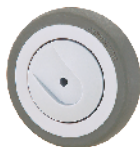
Bánh TPR lõi PP 經典超級人造膠