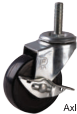
軸剎 Axle Lock Brake