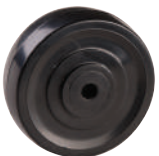
聚乙烯輪 PVC on PP Core