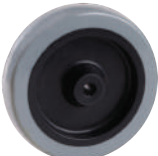
超級人造膠 TPR on PP Core