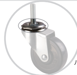
八角波盤 Octagon Raceway