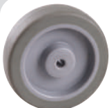
高科技耐磨聚氨酯 PU on PP Core